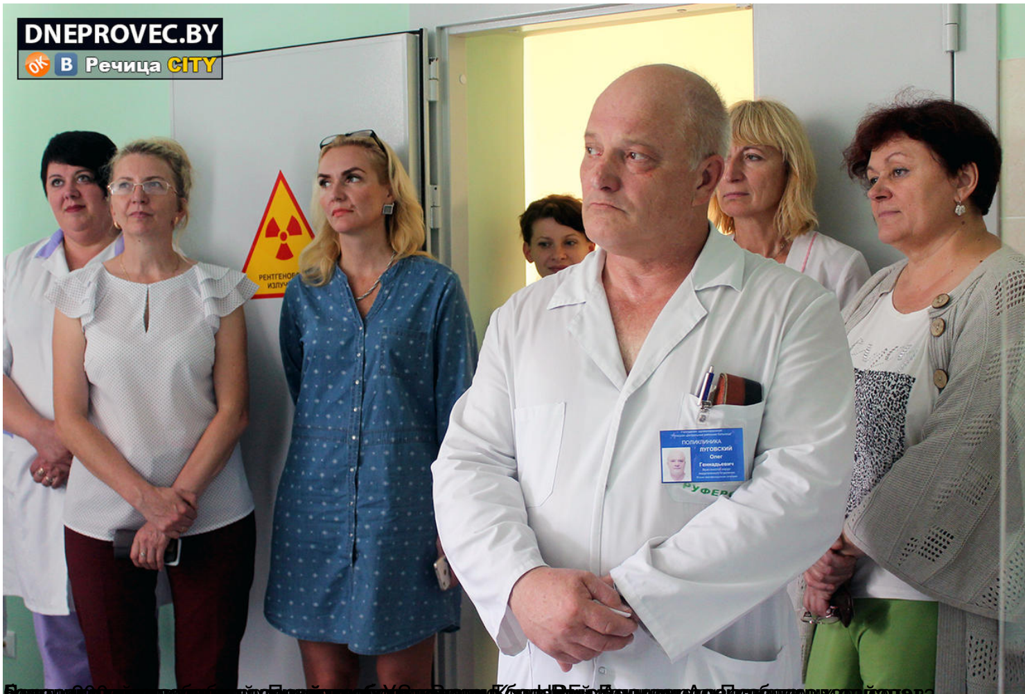
Вот так выглядит кабинет рентгеномаммографии в центральной поликлинике Речицы. Кабинет открылся в День Девочки.